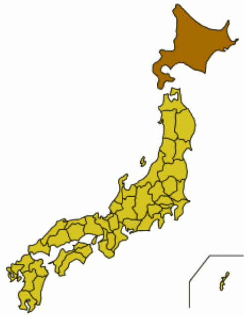
Carte du Japon avec la Préfecture de Hokkaidō mise en évidence.