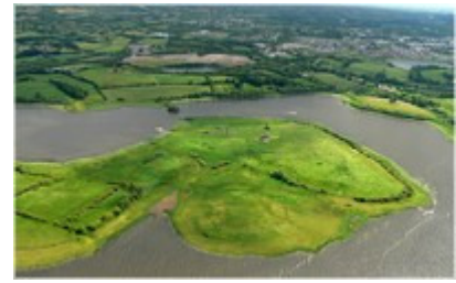
Comté de Fermanagh